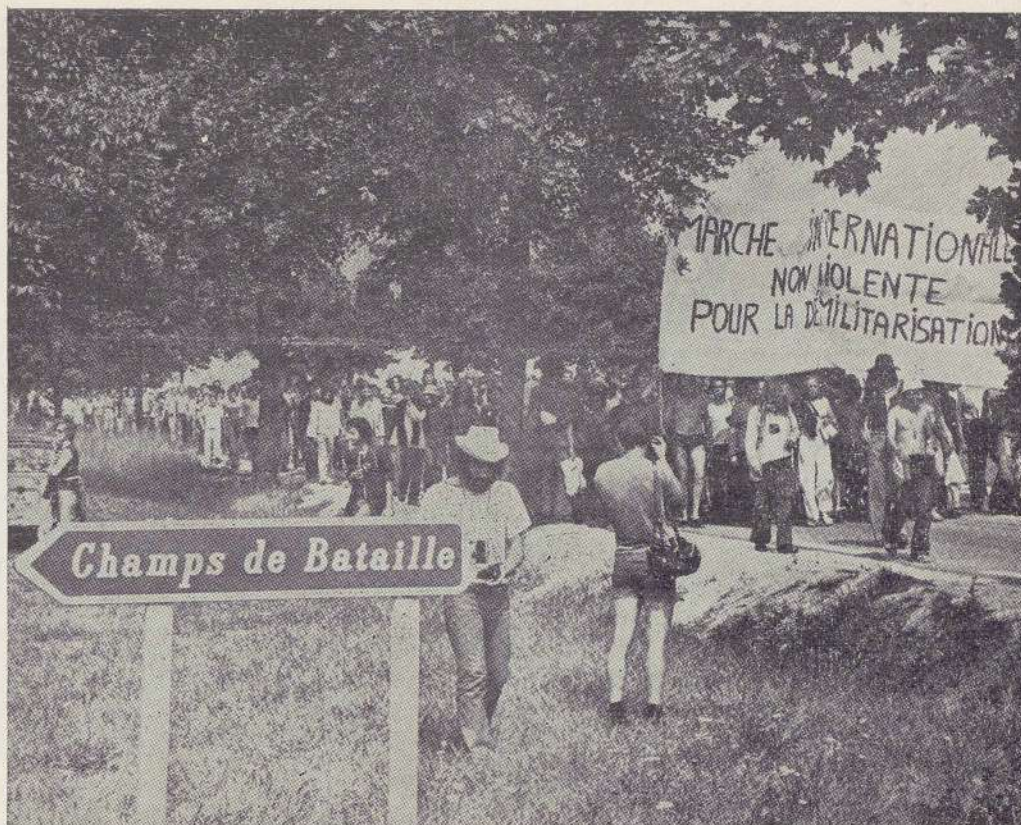
VERDUN, 8 AGOSTO — Il corteo di 1.500 persone mentre sta raggiungendo il cimitero militare di Douaumont, il piú grande del mondo, con 130.000 morti della 1ª guerra mondiale.

Quando ritorno a Sulcy è già mezzanotte passata e non trovo piú un italiano e tantomeno il pulmino che doveva portarci al centro LSD (per il ricupero dei drogati) dove dovevamo pernottare e avevo prima scaricato il mio bagaglio. Il funzionalissimo « accueil » (segreteria mobile di accoglienza