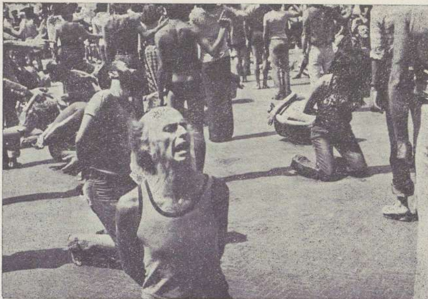
La Maddalena, 19 agosto ore 12 - Un aspetto della rappresentazione del Living Theatre e dei marciatori sugli arbitri e delitti del potere.

Ci viene data conferma che anche questa sera dormiremo, noi italiani, in un fienile; non ce la faccio proprio più: o riesco a togliermi di dosso polvere e sudore, a radermi, a lavarmi i denti, o abbandonerò la marcia. Poi ci ripenso: non dice il Vangelo «bussate e vi sarà aperto, chiedete e vi sarà dato»? Questa frase deve riferirsi essenzialmente ai bisogni spirituali, ma perché dovrei escluderne la validità in rapporto a quelli corporali? decido di farne la prova all'istante. Invece di unirmi ai compagni che fanno coda per la cena, mi metto a girellare. Incontro subito una coppia di mezza età che passeggia con un cane, mi avvicino e chiedo se posso fare un bagno a casa loro. Si guardano stupiti, poi con un sorriso incerto mi dicono di sì. Ci avviamo verso la periferia, mi chiedono della marcia, del mio paese; saputo, mi dicono che molti a Jarny sono di origine italiana, discendenti di una vecchia immigrazione venuta lì per lavorare in miniera. Giunti a casa, una modesta villetta, la signora mi accompagna al bagno: sotto l'acqua mi sento ora rivivere, e posso poi tornare dai miei compagni con un senso di pieno benessere. E' finita la distribuzione della cena, mi basta avere pane e formaggio. Terminati gli interventi, inizia alle 23 la proiezione del film; ma l'altoparlante chiama gli italiani al pulman: l'autista non sta bene e vuole andare a coricarsi; non è il caso di farsi poi a piedi i 6 km. da cui dista il fienile.